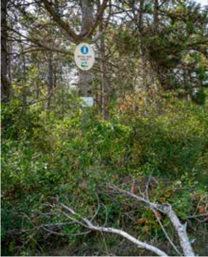
Idegenhonos állományban kell megtalálni a védendő élőhelyeket

a felmérés technológiáinak különbözőségéből fakad. A különbség ugyanakkor közvetlen hatással van a szénkészlet és a jövőbeni növedék becslésére, így a karbonmérlegre is.